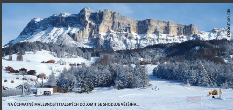
NA ÚCHVATNÉ MALEBNOSTI ITALSKÝCH DOLOMIT SE SHODUJE VĚTŠINA...

KOLIKRÁT JSEM TUTO VĚTU SLYŠEL V KONTEXTU HOVORŮ, KAM SE VYDAT NA LYŽE. ŘEČENO JAK? PEJORATIVNĚ, JAKO POVZDECH, JAKO KONSTATOVÁNÍ, JAKO PREMISA, JAKO DOGMA, NEBO JAKO MARKETINGOVÝ NÁSTROJ CESTOVNÍCH KANCELÁŘÍ?