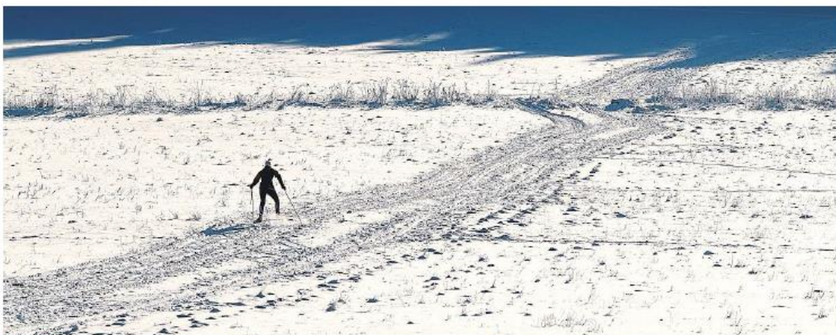
Na běžky do Jizerek Běžkaři by uvítali, kdyby skibusy spojily stěžejní nástupní místa na Jizerskou magistrálu. Ulevilo by se tak i přetíženému Bedřichovu.

Krajská studie upozorňuje na chybějící skibusy, které by spojovaly stěžejní místa jizerskohorské magistrály. Ulevilo by například přetíženému Bedřichovu.