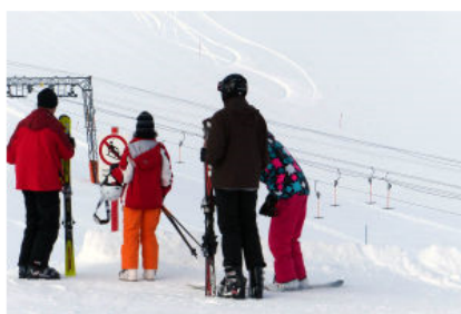
Lyžaři (ilustr. obr.)