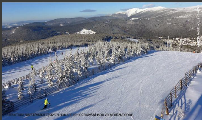
STRUKTURA NÁVŠTĚVNÍKŮ ČESKÝCH HOR A JEJICH OČEKÁVÁNÍ JSOU VELMI RŮZNORODÉ.

PODÍVEJME SE NA VÝVOJ NÁVŠTĚVNOSTI LYŽAŘSKÝCH STŘEDISEK, SAMOZŘEJMĚ ZEJMÉNA S OHLEDEM NA ČESKÉ HORY. JAKÉ JSOU CELKOVÉ POČTY LYŽAŘŮ, STRUKTURA NÁVŠTĚVNÍKŮ A JEJICH OČEKÁVÁNÍ? ZAJÍMAVOU KAPITOLOU JE I VÝVOJ ŠKOLNÍCH LYŽAŘSKÝCH KURZŮ.