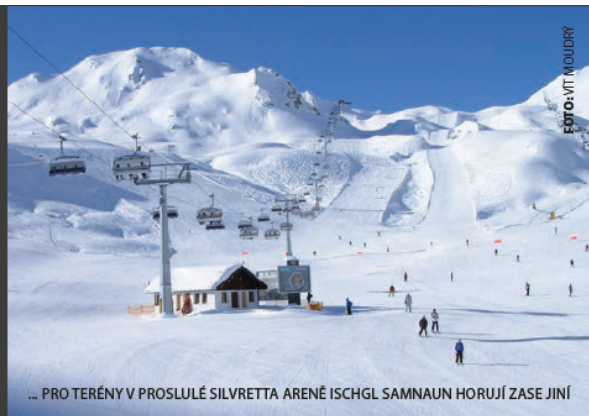
... PRO TERÉNY V PROSLULÉ SILVRETTA ARENĚ ISCHGL SAMNAUN HORUJÍ ZASE JINÍ