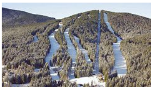
Špičák na Šumavě.

Největší lyžařský areál v Plzeňském kraji soupeří s tvrdou německou konkurencí už řadu let . Jen pár kilometrů od šumavského Špičáku můžou lidé zaparkovat pod svahy Velkého Javoru, který nabízí více kvalitních sjezdovek a lepší zázemí například v podobě útulných restaurací nebo sánkařské dráhy.