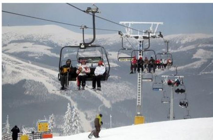
LYŽOVÁNÍ - ILLUSTRACNÍ FOTO.

PRAHA Provozovatelé lyžařských areálů v Česku investovali před zimní sezónou celkem zhruba 900 milionů korun, vyplynulo z ankety. Ceny skipasů se zvýšily hlavně ve větších střediscích, většinou do pěti procent. Nové lanovky vyrostly mimo jiné na Černé hoře v Krkonoších či v Peci pod Sněžkou. Nové sjezdovky budou moci lyžaři využít například ve Skiareálu Lipno nebo v Klínech na Mostecku.