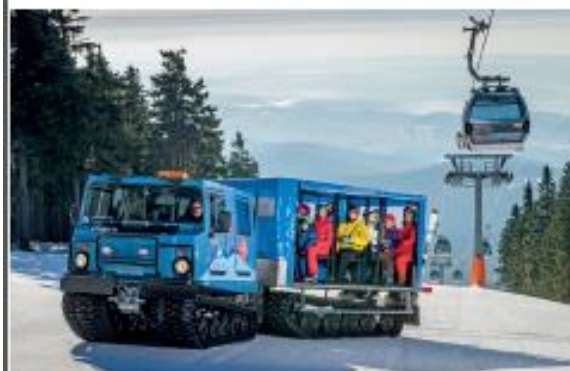
SkiResort ČERNÁ HORA – PEC vstoupil do nové sezony s rekordními investicemi