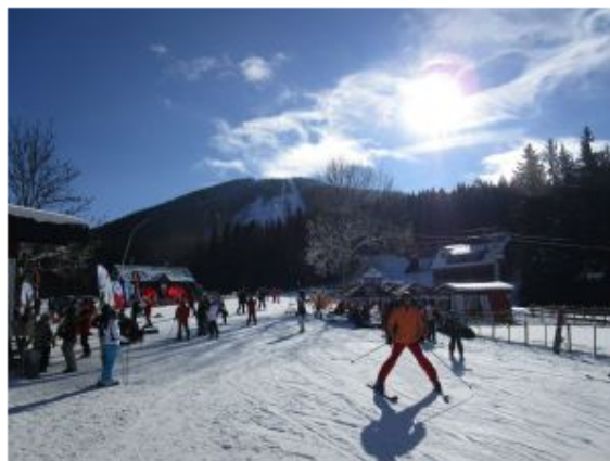
Ačkoliv je zasněžovací technika připravena, mnohé skiareály řeší, kde vezmou na zasněžování vodu (ilustrační foto)