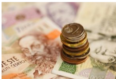
Obce chtějí od státu více peněz (ilustrační foto)

Cestovní ruch přijde o zhruba deset miliard korun. Podpora této oblasti podnikání z evropských fondů na konci letošního roku končí. Zástupci obcí a podnikatelů hledají jiné cesty, jak cestovní ruch financovat. Prioritou je prosazení zákona o podpoře rozvoje cestovního ruchu. Mimo jiné by chtěli sjednotit výběr poplatků, například za ubytování. Podle podnikatelů by mohly pomoci také povinné školní výlety.