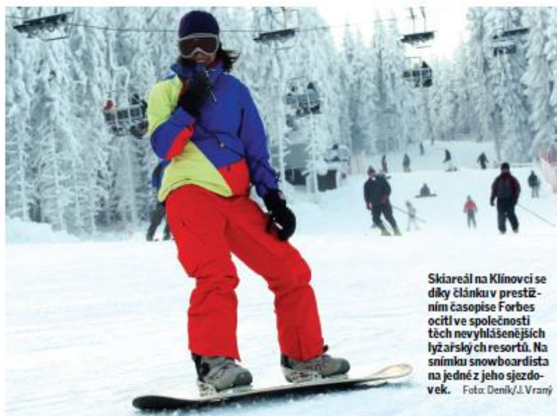
Skiareál na Klínovci se díky článku v prestižním časopise Forbes ocitl ve společnosti těch nevyhlášenějších lyžařských resortů. Na snímku snowboardista na jedné z jeho sjezdovek.

Mnohé čtenáře proto srovnání dráždí a nešetří kritikou. „Další článek, kvůli kterému se člověk mimořádně nasmě-