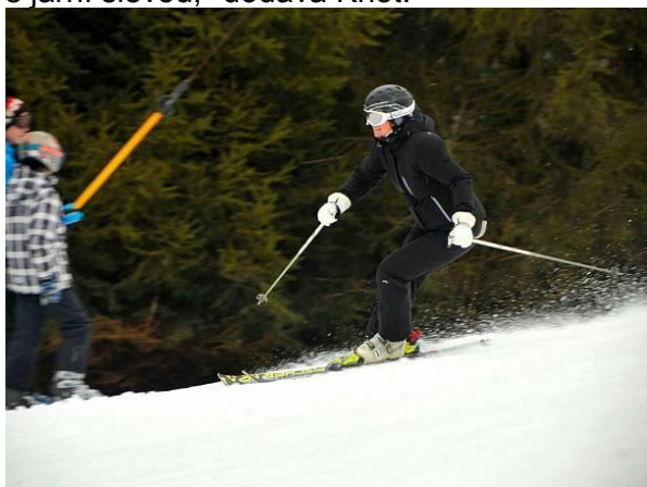
Ilustrační fotoAutor: DENÍK/Lukáš Kaboň

„Díky investicím do zasněžovacích systémů se lyžařské podmínky na českých horách daří udržet i přes nepříznivý klimatický průběh zimy,“ říká Libor Knot z Asociace horských středisek ČR. Přes týden je na sjezdovkách zcela volno, o víkendech jsou zase pro návštěvníky připraveny nejrůznější doplňkové a zábavní akce. Ve většině středisek se navíc dá pořídít již levnější skipas s jarní slevou,“ dodává Knot.