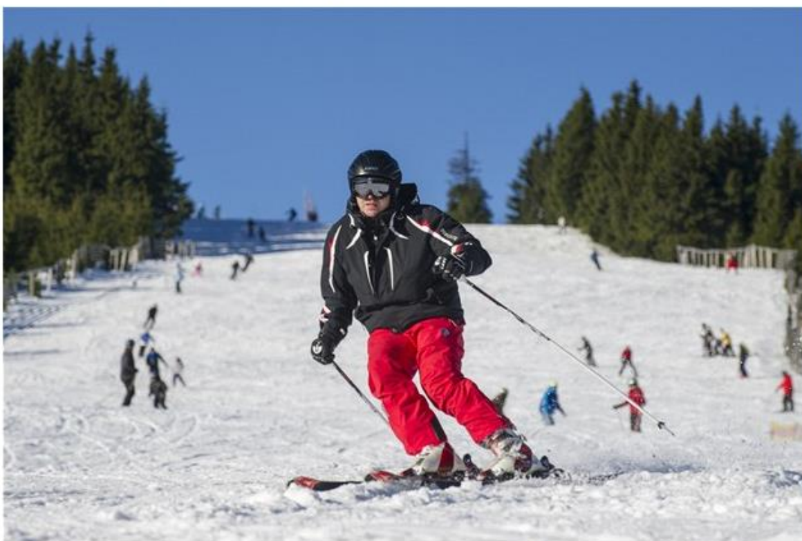
Ceny skipasů jsou žhavé téma u nás, na Slovensku, v Rakousku a zřejmě i všude jinde ve světě.

Ceny skipasů jsou žhavé téma u nás, na Slovensku, v Rakousku a zřejmě i všude jinde ve světě. Nejčastěji si stěžujeme na jejich každoroční růst, nepoměr s velikostí lyžařského areálu nebo placení za malé děti. Některé cenové souvislosti přitom mají racionální důvod, jiné však naopak překvapí.