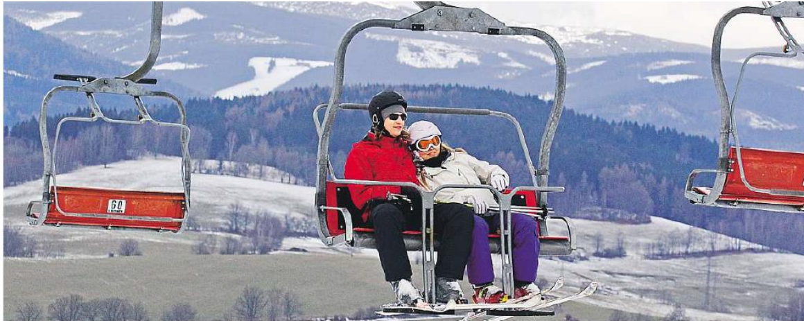
Za sněhem do kopců Nízko položeným sjezdovkám současně počasí nesvědčí, za sněhem musí lyžaři vyrazit do hor.

rubrika: Kraj Hradecký - strana: 4 - autor: (gg)