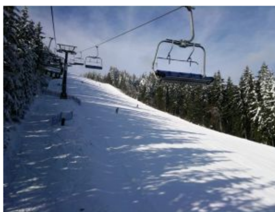
Nový skiareál by měl mít i vlastní lanovku (ilustrační foto)

Výstavba areálu se odkládala kvůli sporu s majitelem jednoho z pozemků, který se odvolával proti územnímu rozhodnutí. Radnice kvůli tomu přišla i o možnost až šedesátiprocentního pokrytí nákladů z dotací.