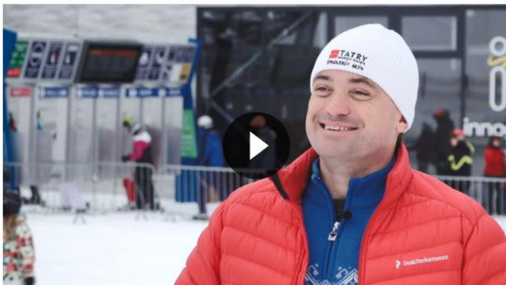
Peníze, nebo život: Tanec miliard v lyžařských střediscích. Krakonoše vytlačují z hor mocní byznysmeni. (Video: Zuzana Kubátová)

„Dovedeme si představit jiné záměry, které by daleko lépe odpovídaly relaxační úloze Centrálního parku. Každopádně se jedná o veřejný prostor, o jehož osudu by neměl starosta s radními rozhodovat bez seriózní veřejné diskuze,“ uvedla koalice ve svém prohlášení.