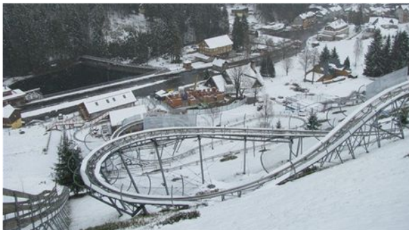
PEC POD SNĚŽKOU ZAPADLA SNĚHEM.

PEC POD SNĚŽKOU Výstavba nového dopravního terminálu s parkovacím domem pro 450 automobilů u čerpací stanice v Peci pod Sněžkou za 167 milionů korun bez DPH začne začátkem července. Ve výběrovém řízení na zhotovitele zvítězilo sdružení firem Chládek a Tintěra a BAK, řekl starosta horského města Alan Tomášek.