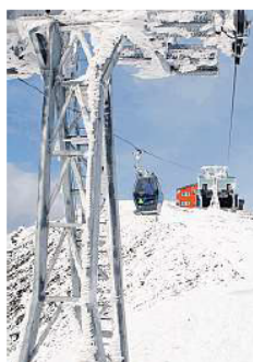
Jako dosud poslední vznikla lanovka na Sněžku.

Zde plánují výměnu vleků za lanovky na sjezdovkách Zahrádky a Javor. „Nemůžeme dělat investice v řádech stovek milionů korun, aniž bychom neměli dlouhodobý právní vztah k pozemkům ve vlastnictví státu,“ upozornil Hynek. Ve-