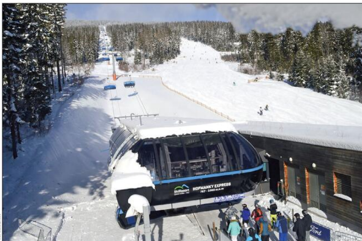
Naplně jede SkiResort Černá hora–Pec

Dálnice rokytnických sjezdovek pokrývá směs čerstvě napadaného převládajícího a stále vyráběného technického sněhu. Obě složky se tak ideálně