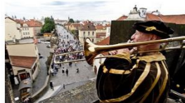
ZANIKLÉ TRATĚ: Volarská spojka je nejzáhadnější dráhou u nás

Vážné se ze sportu, který patřil ke každému českému kopci, stává finančně nedostupné povyražení?