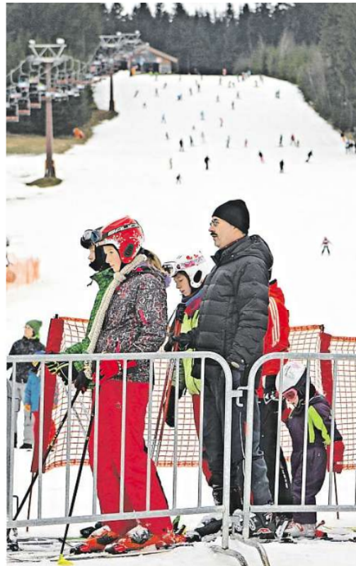
Dobrá sezona Pro lyžařské areály byla letošní zima lepší než loňská (na snímku skiareál v Novém Městě na Moravě).