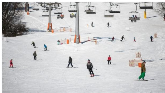
Vzáří, ilustrační foto

Lyžování na českých a moravských svazích letos logicky vyjde draž než loni. Můžete říct, o kolik to bude procent?