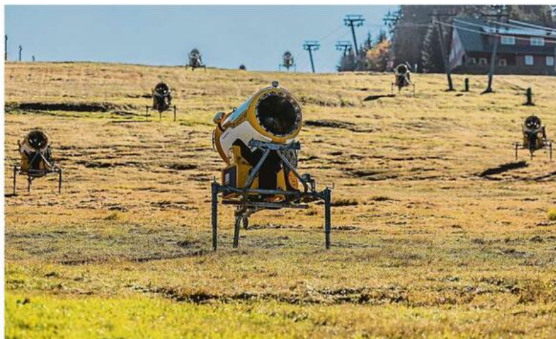
Vlekaři se připravují na sezonu. Zasněžovací technika je už na svazích i v Peci pod Sněžkou.

Problémem číslo jedna už nejsou obavy z vládních protiepidemických opatření, nýbrž extrémně vysoké ceny energií. Před pár týdny ohlášené zastropování cen elektřiny a plynu se vztahuje pouze na menší střediska. Největší skiareály, například Špindlerův Mlýn, zatím nemají žádnou státní podporu přislíbenou. Dal-