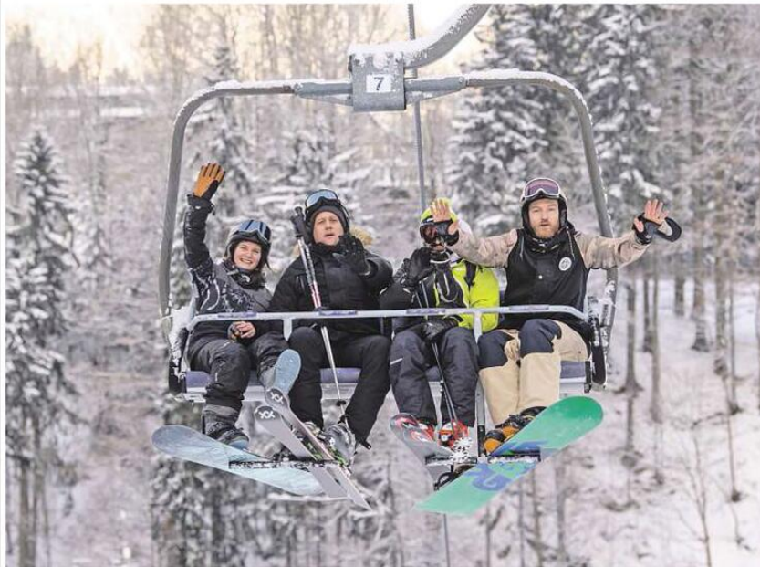
Ve Špindlerově Mlýně se chystají rozjet lyžařskou sezonu v plném rozsahu a bez omezení hned, jak to počasí dovolí. A to i přesto, že na areál se zatím nevztahuje státní pomoc ve formě zastropování cen energií.

Příspěvek o zásněžování měl být signálem pro zákazníky, že lyžovat se letos přes všechny nejistoty bude. „I proto mě mrzí kritika od kolegů z branže. Zatímco oni tise doufají, že se o nich nebude mluvit, tak jejich klienti kvůli nejistotě nakupují zájezdy na zimu v Dubaji a jinde. Naše data ukazují, že lidé na horách ubude, cestovky prodávající zimní zájezdy do tepla teď mají žně. Několik lidí musel nahlas říci, že lyžovat se bude,“ rozčiluje se Jilek.