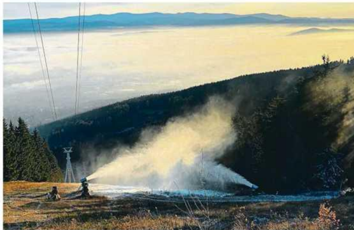
Sněží Na Ještědu začali zasněžovat minulou sobotu. Vodu čerpají z retenční nádrže u Bucharky.

Rokytnice ještě nezačala zasněžovat. Areál přesto doufá, že zahájí sezonu kolem 20. prosince. „Teď bych si paradoxně přál, aby ještě nemrzlo a čtrnáct dní přišlo. Zvýšil by se průtok potoků a hory by naku-