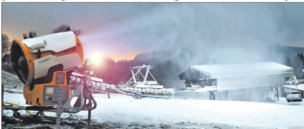
Kanonáda sněžných děl v orlickohorském Deštném.

Úřady pro letošek skiareály neomezují nižšími odběry vody. „Mohou bezplatně odebrat stejné množství jako dříve. Musí je dodržovat stanovenou hladinu průtoku v tocích, odkud