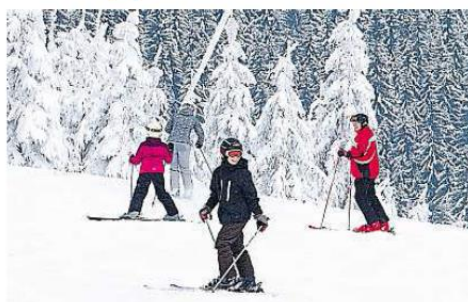
Takto se v lednu lyžovalo pod Ještědem.