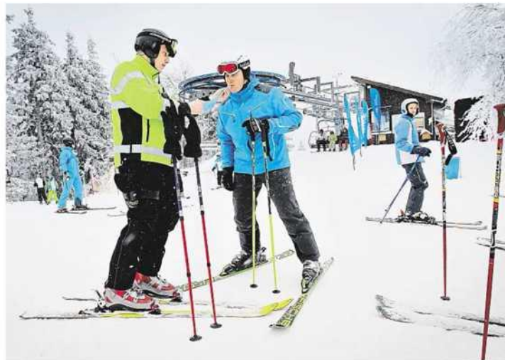
Kontrola Policisté na lyžích kontrolují ve spolupráci s horskou službou lyžaře na sjezdovkách.

Šéf šumavské horské služby Michal Jandura řekl, že k vyšší bezpečnosti přispívá i stále lepší vybavení lyžařů. „Řadu let se snažíme půso-