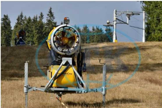
Sněžné dělo

Aktualizace: 15.04.2018 10:18 Vydáno: 15.04.2018, 10:10