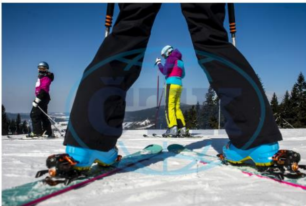
Lýžaři na sjezdovce. Ilustrační foto.

Aktualizace: 10.04.2018 21:26 Vydáno: 10.04.2018, 13:33